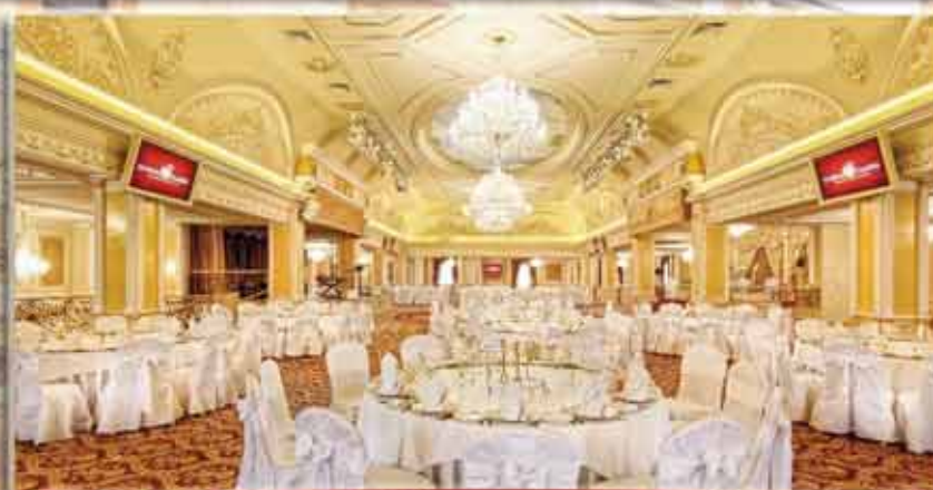
Большой банкетный зал от 200 до 600 человек