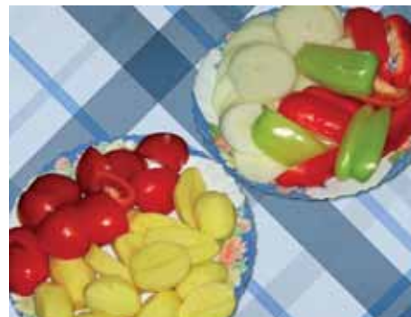
2. Лук нарезаем кольцами, перец – дольками, помидоры режем на четыре части, кабачки – кружками, картошку очищаем и режем пополам