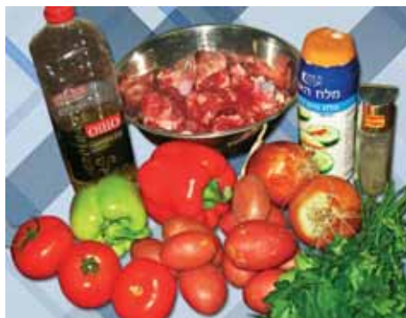
1. Подготавливаем все необходимые ингредиенты для нашей Хашламы

Хаг Ханука sameax! Веселого вам праздника Ханука!