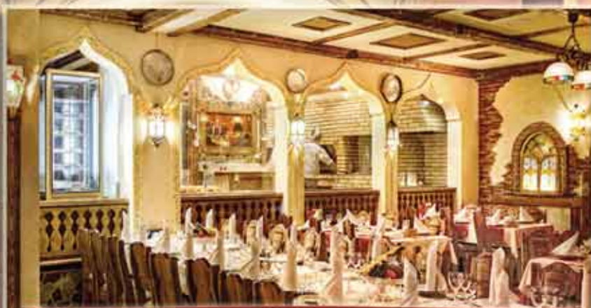
Ресторан "Шахин-Шах" до 200 человек