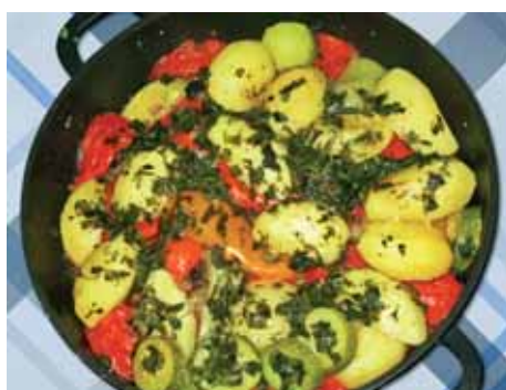
11. Ставим сотейник на огонь, закрываем крышкой и варим час-полтора: сначала на среднем, а после закипания – на маленьком огне