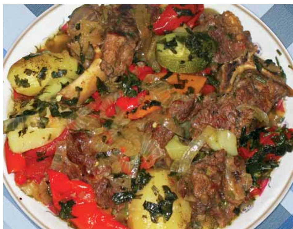
12. Приятного аппетита! Халол ишму! Хаг Ханука sameax! Веселого вам праздника Ханука!