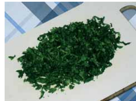
3. Зелень – петрушку и кинзу – мелко крошим