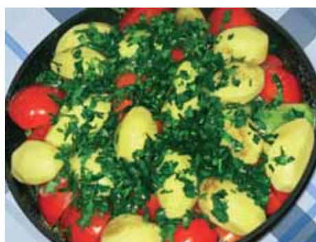
10. Посыпаем мелко накрошенной зеленью