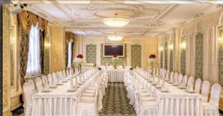
Зал "Версаль" от 50 до 100 человек