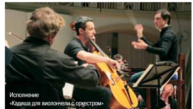
Исполнение «Кадиша для виолончели с оркестром»

Все материалы и комментарии читайте на www.stmegi.com