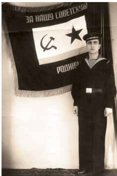
При развернутом Боевом знамени воинской части

Прошло полгода. Из редакции «Комсомольской правды» пришел ответ. Я раскрыл конверт, а там были экземпляры газеты и письмо, в котором сообщалось, что я стал победителем в этом конкурсе. Вместе с газетой пришла и премия за «Фомку» – денежный