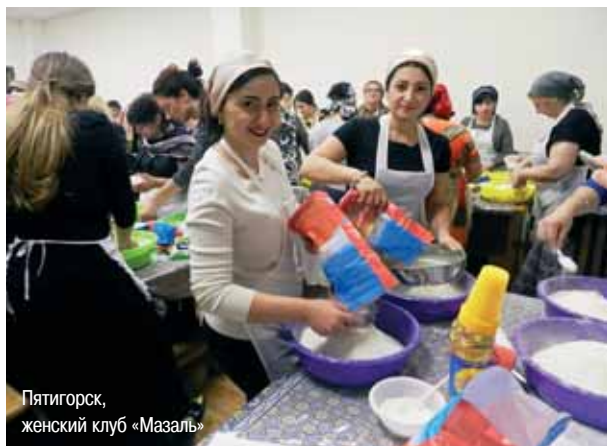
Пятигорск, женский клуб «Мазаль»