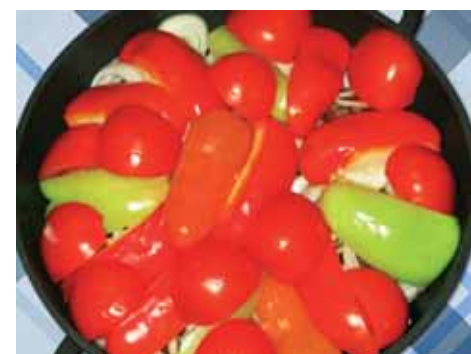
7. Поверх перцев раскладываем помидоры