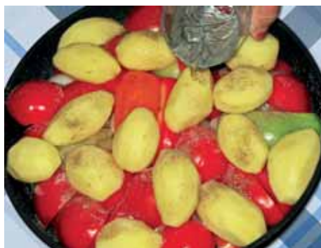
9. Добавляем соль, черный перец и стакан кипяченой воды