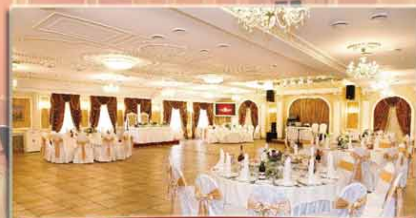
Итальянский зал до 170 человек