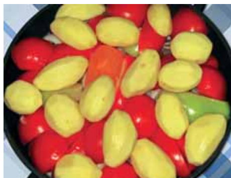
8. На помидоры раскладываем картофель и кабачки, не допуская, чтобы помидоры соприкасались с картофелем, иначе он останется твердым