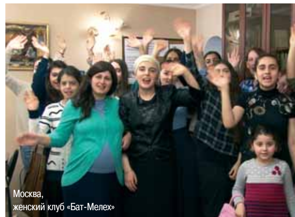
Москва, женский клуб «Бат-Мелех»

В течение месяца в социальной сети Facebook в группе ешивы «Шаарей Кедуша» шло голосование. За главный приз боролись 12 девушек, они представили на суд зрителей и компетентного жюри 25 хал.