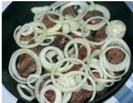
5. Поверх мяса раскладываем нарезанный кольцами лук