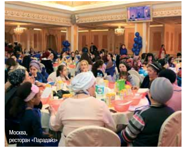
Москва, ресторан «Парадайз»

Вернемся в Москву – в женский клуб «Бат-Мелех», что при ешиве «Шаарей Кедуша», где к праздничному ноябрьскому событию завершился конкурс на выпечку лучшей халы.