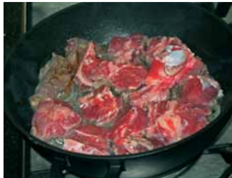
4. В глубокий сотейник наливаем масло, разогреваем, выкладываем предварительно вымытое, посоленное и поперченное мясо и слегка обжариваем с двух сторон