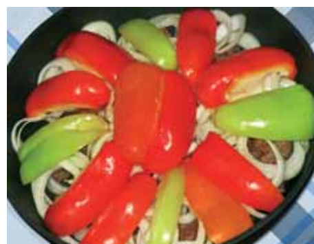
6. Поверх лука раскладываем цветные дольки перцев