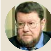
Евгений САТОНОВСКИЙ президент Института Ближнего Востока