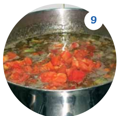
9 Варим еще 10 минут – и наша легендарная библейская чечевичная похлебка готова. Приятного аппетита!