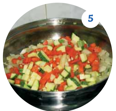
5 Когда лук немного поджарится, добавляем нарезанные морковь и цукини, щепотку зиры и куркуму