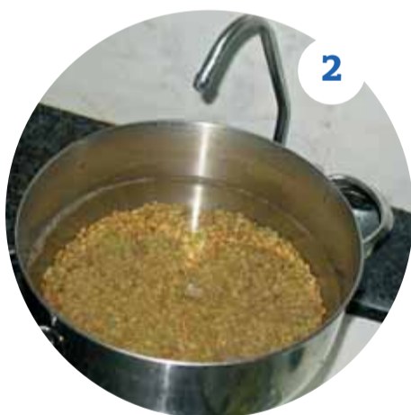
2 Наливаем в большую кастрюлю 2,5 литра воды, чечевицу промываем, пересыпаем в кастрюлю с водой и ставим на огонь