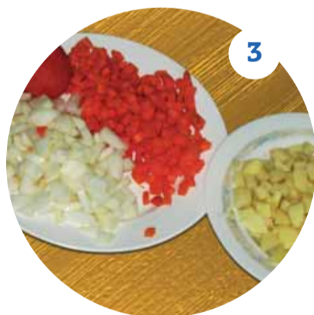
3 Мелко нарезаем лук, морковь, цукини, картофель, крошим чеснок и зелень