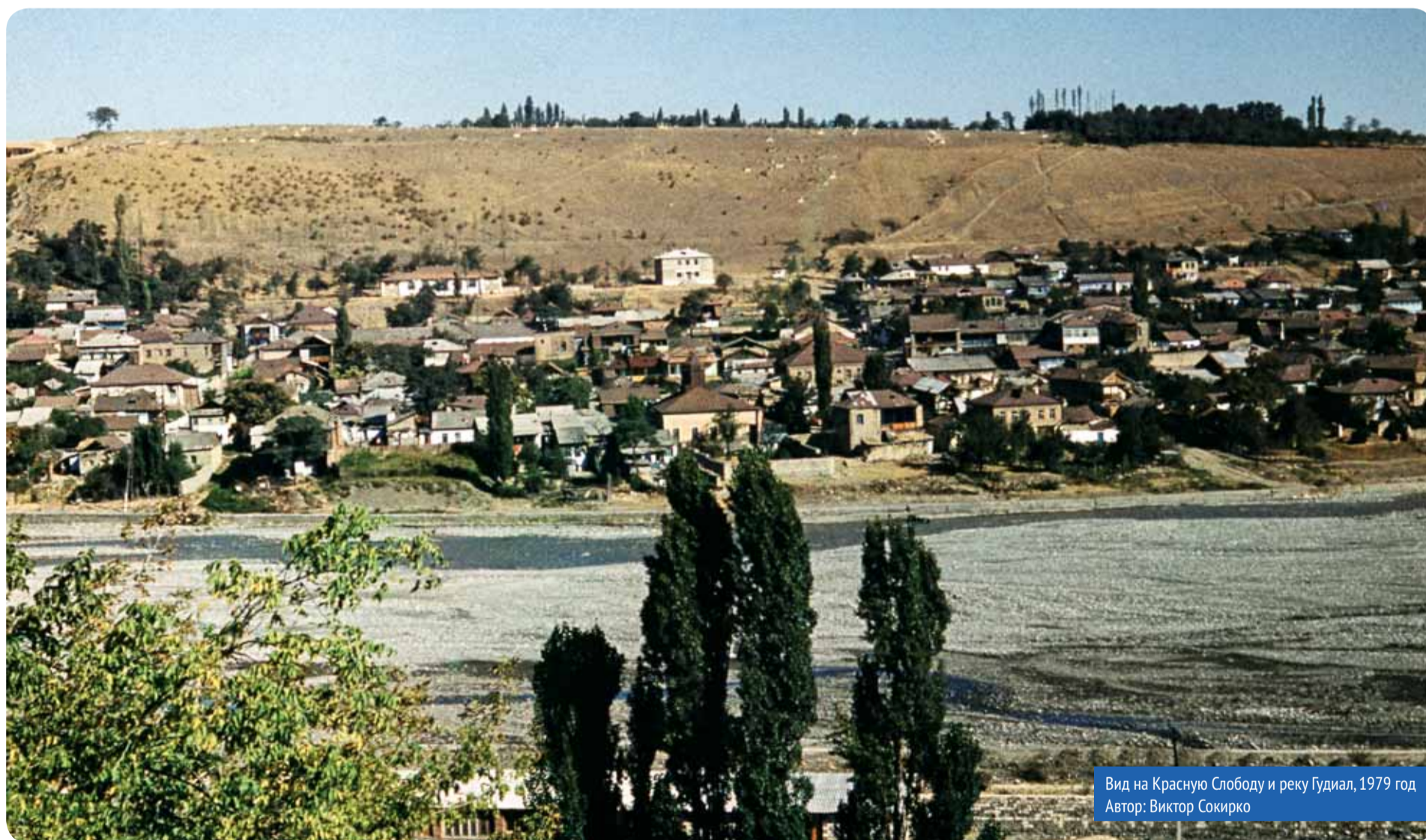
Вид на Красную Слободу и реку Гудиял, 1979 год

Оператор Александр Шабатаев о мэтрах советского кино