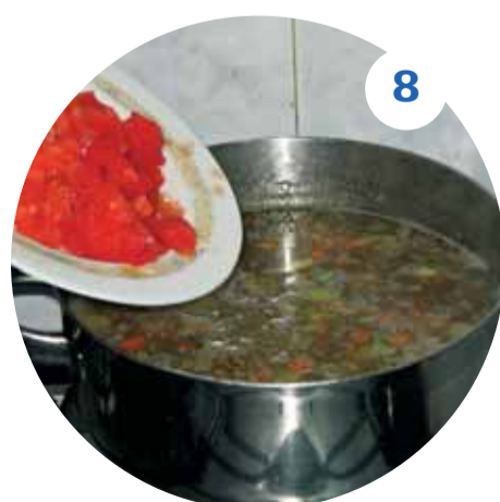
8 Помидор очищаем от шкурки, мелко нарезаем и добавляем в кастрюлю