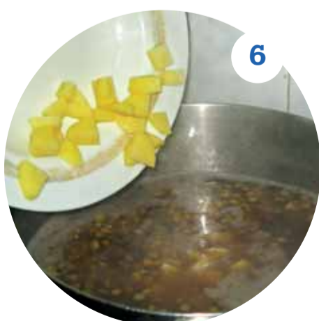
6 Через 10 минут варки чечевицы пересыпаем в кастрюлю нарезанный картофель и продолжаем варить