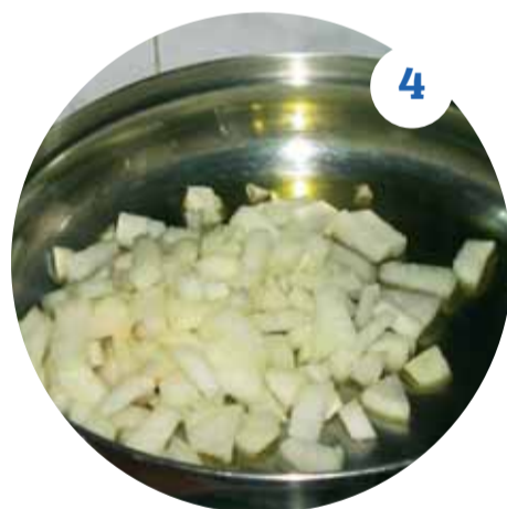
4 В сковородку среднего размера наливаем масло, перекладываем туда лук и ставим на огонь