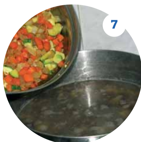
7 Еще через 10 минут в кастрюлю добавляем поджарку с луком и овощами, солим, перчим, перемешиваем и даем повариться 15 минут