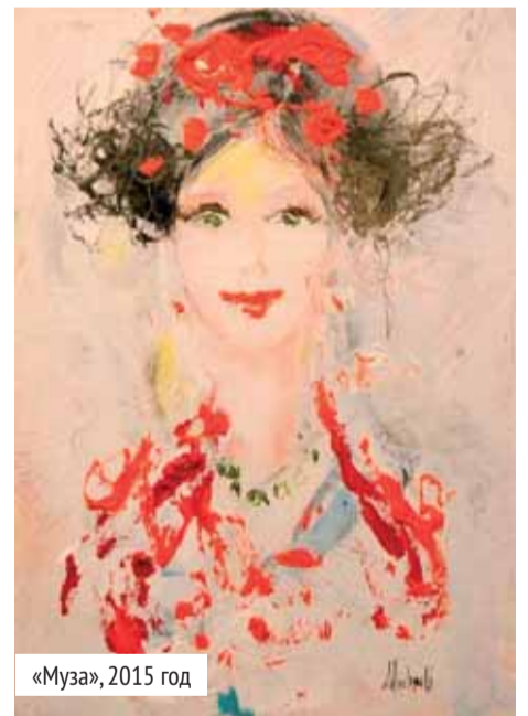
«Муза», 2015 год