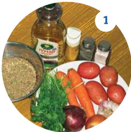
1 Подготавливаем все необходимые ингредиенты для нашей чечевичной похлебки

При подаче на стол посыпьте тарелку накрошенной зеленью – это придаст блюду пикантность