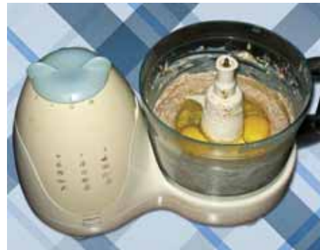
4. Добавляем в смесь ванильный сахар и яйца, перемешиваем или прокручиваем в миксере