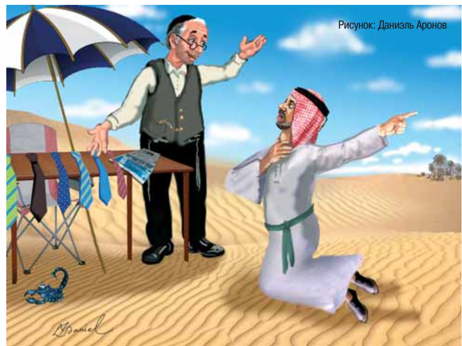
Рисунок: Даниэль Аронов

– Я умираю от жажды. Дайте воды! – У меня нет воды. А галстук не хотите? Недорого уступлю. Вот этот, например, просто идеально вам подойдет... – Зачем мне твои паршивые галстуки?! Я хочу пить! – Ну что ж, нет так нет. Но я дам вам совет. Километрах в пяти отсюда есть замечательный рестораник. Вон за тем холмом. Там сколько угодно воды. Араб направился по направлению, указанному евреем, и вскоре его одинокая фигура исчезла за барханами. Через несколько часов он вернулся, едва держась на ногах, и повалился на землю. – Неужели не нашли? – поинтересовался еврей. – Нашёл, – прохрипел араб. – Но твой брат не впускает без галстука!