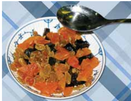
2. Сухофрукты заливаем 3–4 столовыми ложками рома или вина – по вкусу