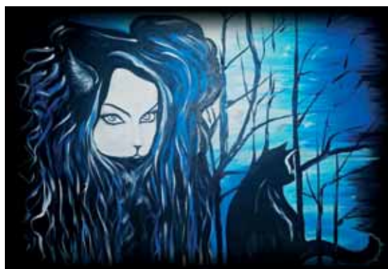
«Женщина-кошка», 2016 год