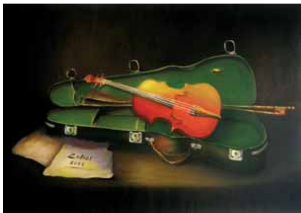
«Скрипка Меира», 2013 год