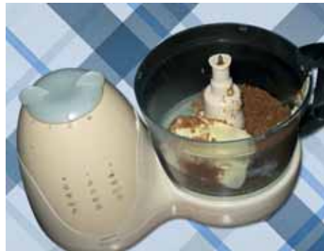
3. Вначале смешиваем в миксере или вручную сахар и сливочное масло