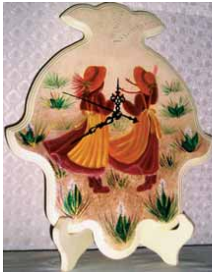
«Деревенские мотивы», 2010 год