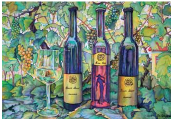
«Головокружительный напиток», 2015 год