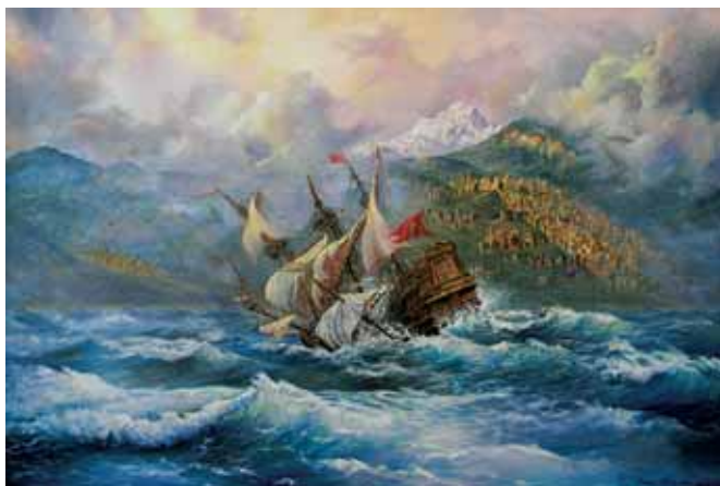
«Гибель «Фредерика» под Дербентом», 2012 год