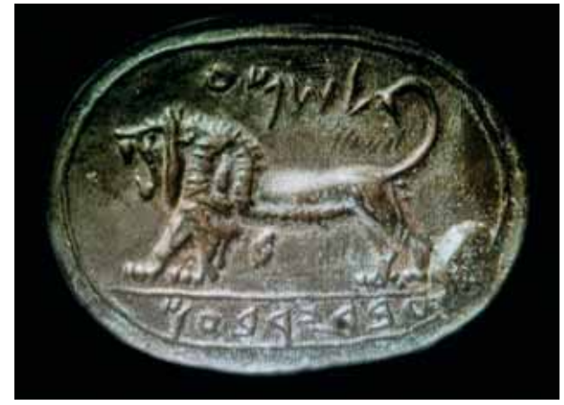
Подлинная фотография знаменитой печати Шемы, обнаруженной немецким археологом Готтлибом Шумахером при раскопках Мегиддо в 1903 году. Каменная, из яшмы печать принадлежала Шеме, правившему в Мегиддо наместнику Иеровоама II — царя, при котором Северное Иудейское царство достигло наивысшего расцвета. Надпись на печати гласит «Шема, слуга Иеровоама», и владелец использовал ее в государственных и торговых делах. Отправленная в музей Константинополя, ценнейшая реликвия 2700-летней давности была загадочным образом утрачена.

Впрочем, Питри всё же более известен как один из основоположников систематической египтологии. А еще он определил возраст Стоунхенджа, исследовал пирамиду Хеопса, раскопал в Танисе колосс Рамзеса II, уточнил время существования Микенской цивилизации, в 1912 году нашел на Синопском полуострове памятники протосемитской письменности... Самое же интересное — в 1896-м при раскопках в Фивах он обнаружил стелу Мернептаха, известную и как Израильская стела. Это