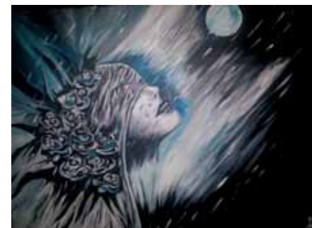
«Последний вдох», 2013 год