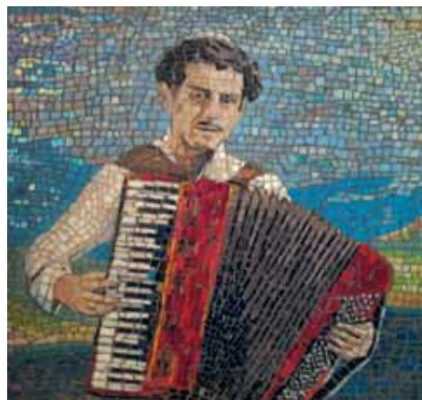
«Отец», 2015 год