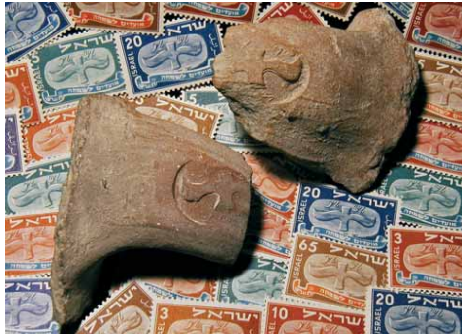
Осколки древних керамических кувшинов с так называемыми LMLK-печатами — свидетельствующими, что эти сосуды со всем содержимым были собственностью царя Иудеи, и почтовые марки в честь первого в истории независимого Израиля праздника Рош ха-Шана, выпущенные в обращение 26 сентября 1948 года. Надписи на LMLK-печатах, запечатленных на марках, говорят, что этими кувшинами с вином или маслом уплачены налоги в царскую казну.

Но в целом библейская археология вначале занималась не более чем разведкой — наносилось на карты и изучалось лишь сохранившееся на поверхности. Например, первые раскопки в Иерусалиме были предприняты в 1867 году британским