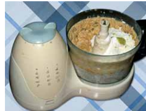
5. Добавляем муку, молоко, разрыхлитель, лимонную цедру и прокручиваем всё в миксере