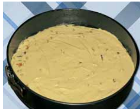
8. Смазываем противень сливочным маслом, перекладываем туда готовую массу, расправляем ее и выпекаем пирог 45 минут в турбо-режиме при температуре 180 °С