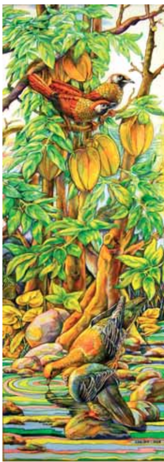
«Птицы в лесу», 2015 год