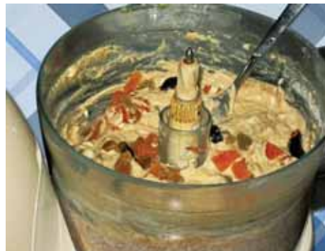
7. Тщательно перемешиваем всё ложкой