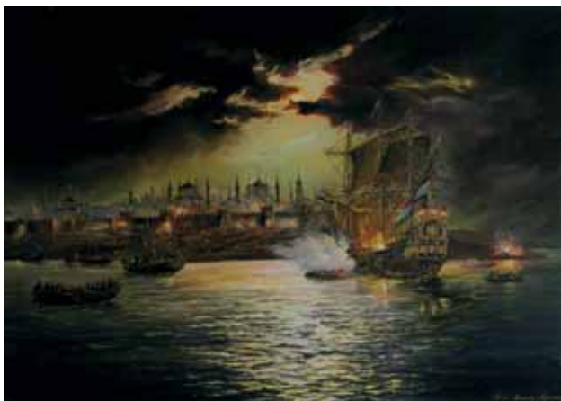
«Захват казаками Степана Разина парусника «Срёл» в Астрахани», 2012 год