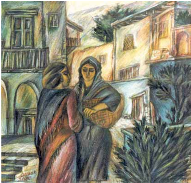
Симха Ашуоров «Беседа», 1986 год

– Тевриз будет, духтер Туре, чуду делать. А, вот и она! Пришла? Чу хабери? 2 – В кухню зашла толстая Туре, которая всю жизнь работала кухаркой