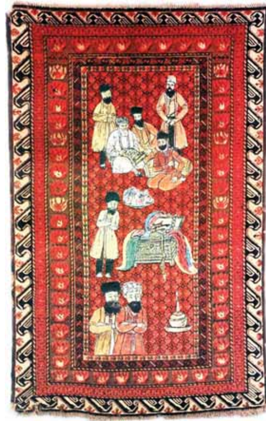
«Записки в Клубе», ковер, 2003 год