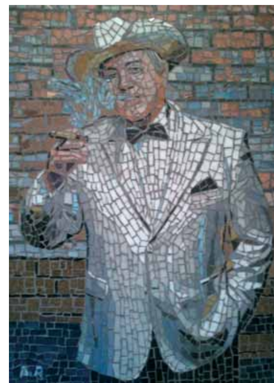
«Владимир Винокур», 2015 год