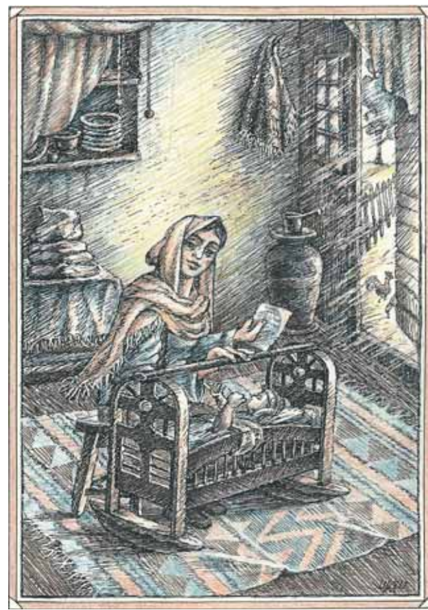
«Письмо Нергюз», 2013 год