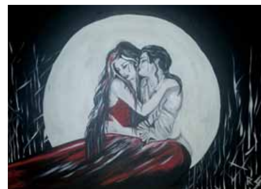
«Страстная ночь вампира», 2016 год