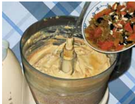
6. В конце добавляем сухофрукты и орехи