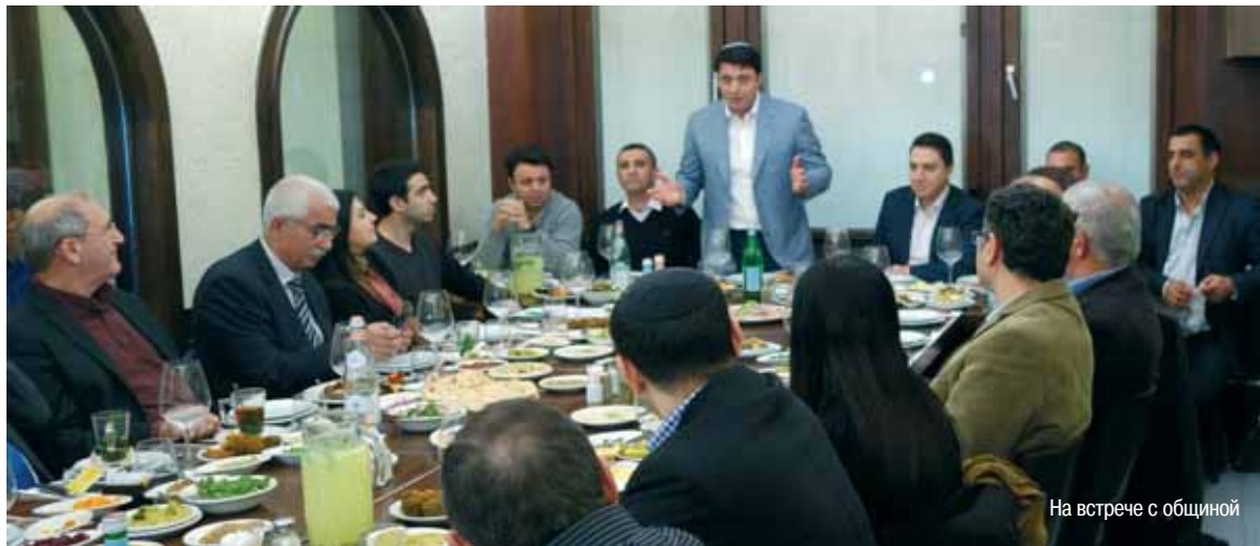
На встрече с общиной

Израиль – маленькая страна, и практически в каждом городе существует несколько общинных горско-еврейских организаций, которые зачастую не могут договориться друг с другом о совместной