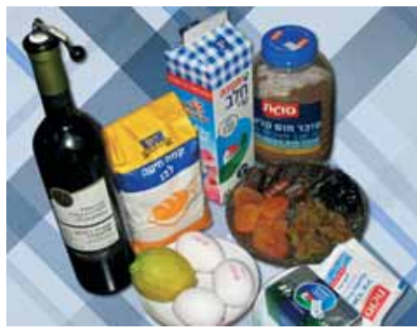
1. Подготавливаем все необходимые ингредиенты

Готовый пирог можно посыпать сахарной пудрой.