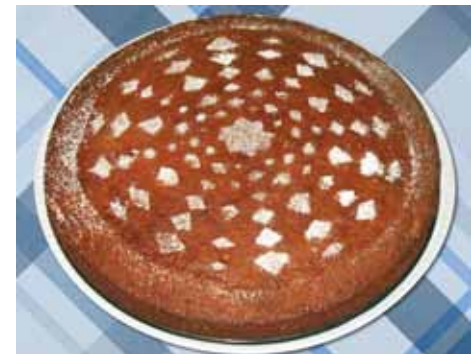
9. Наш изумительный, вкуснейший пирог на Ту би-Шват готов. Остался последний штрих: чтобы он получился еще красивее, посыпьте его сахарной пудрой!

Все материалы и комментарии читайте на www.stmegi.com