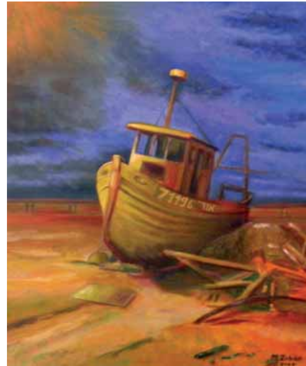
«Старая заброшенная яхта в порту Яффо», 2007 год