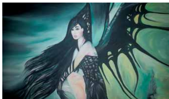
«Ангел тьмы», 2012 год