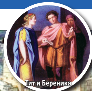
Тит и Береника