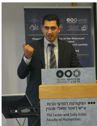
Марк Ифраимов, депутат Кнессета от партии «Наш дом Израиль»