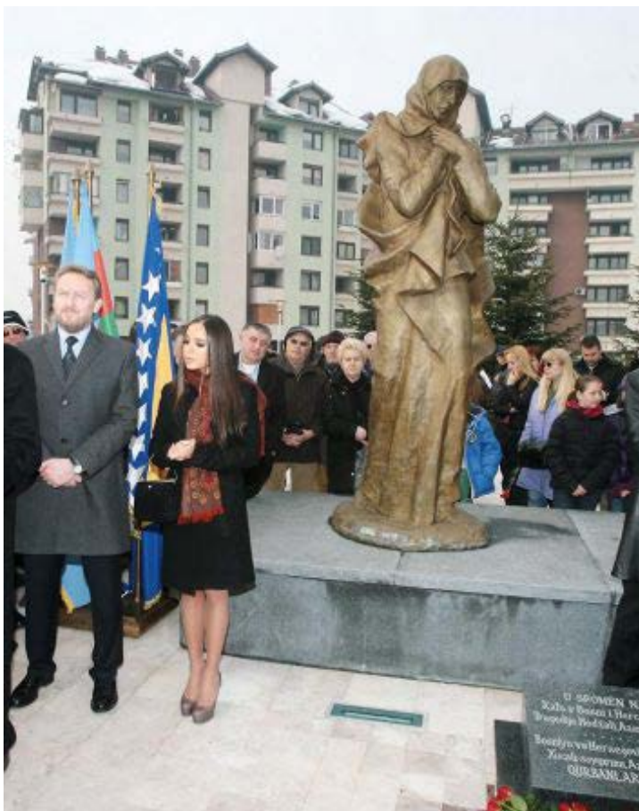
Вице-президент Фонда Гейдара Алиева Лейла Алиева на церемонии открытия памятника жертвам Ходжалинской трагедии в столице Боснии и Герцеговины, городе Сараево, 25 февраля 2012 года. Автор монумента – Натик Алиев.