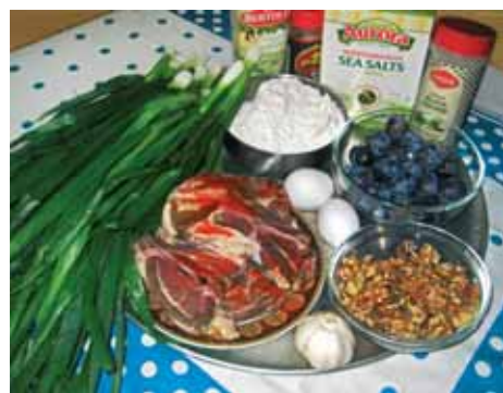
1. Подготовим все продукты, необходимые для нашего Ингъар-пола