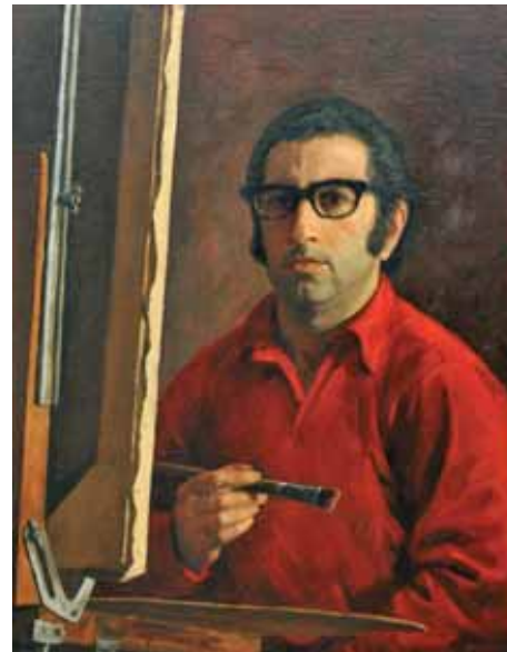
Автопортрет, 1975 год