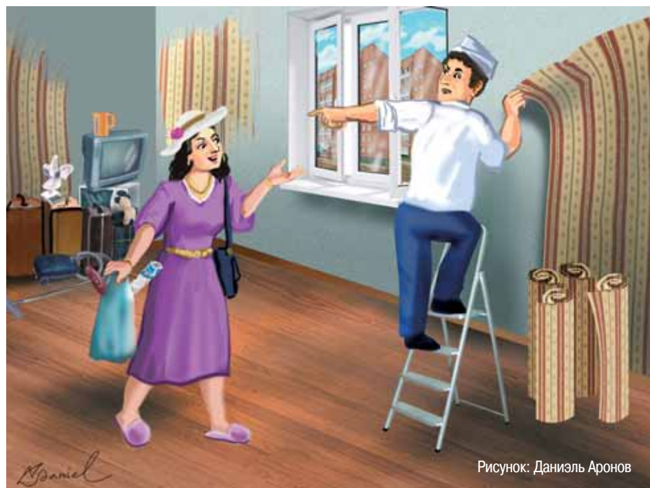
Рисунок: Даниэль Аронов