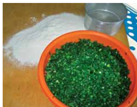
6. Затем лук надо обсушить и мелко нарезать, а муку – просеять