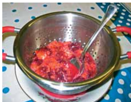
3. Остывшие фрукты пропустим через блендер или разомнем ложкой