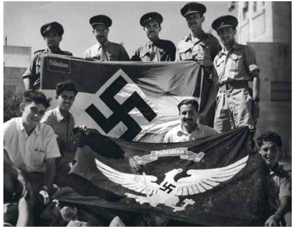
Молодые еврейские бойцы с флагами, найденными в немецкой колонии в Иерусалиме

А теперь обратим внимание на темплеров — выходцев из Германии. Темплеры (от немецкого Tempel — храм) принадлежали к религиозной организации «Храмовое общество» (или «Друзья