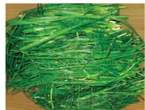
5. Зеленый лук нужно перебрать, тщательно промыть и откшеровать