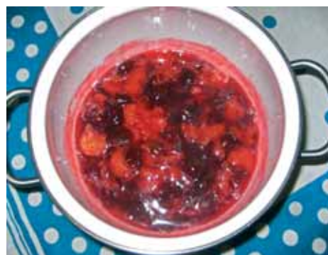
2. Сварим на медленном огне фрукты для кислого соуса