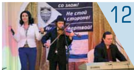
12 Как отпраздновали День Спасения и Освобождения в разных странах мира