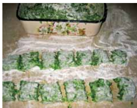
7. Замешиваем тесто из всех ингредиентов, формуем и нарезаем на квадратики