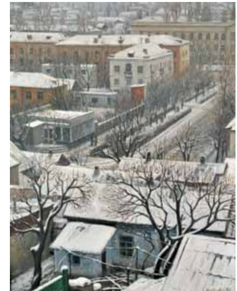
«Махачкала. Вид на университет»