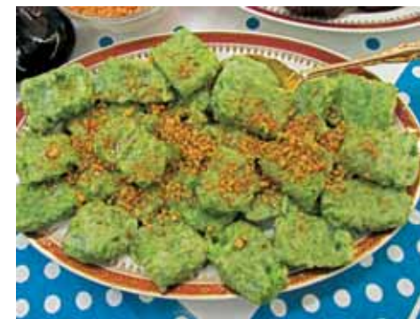
9. Шумовкой собираем Ингъар-пол на блюдо, поливаем маслом и посыпаем орехами