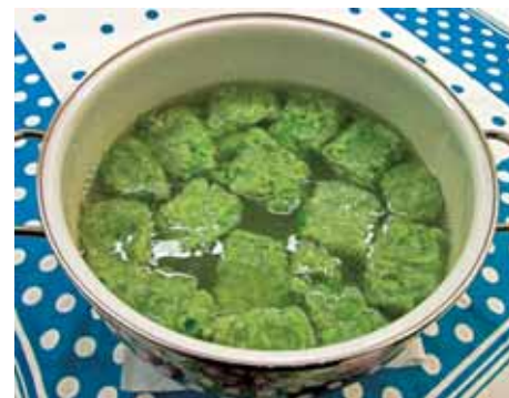
8. Варим квадратик Ингъар-пола в течение 3–5 минут