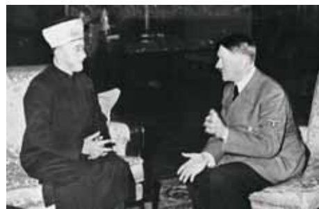
Аль-Хусейни и Адольф Гитлер, 28 ноября 1941 года

Впоследствии аль-Хусейни (кстати, ежемесячно получавший в Берлине по 50 000 рейхсмарок) предлагал немцам много чего — от создания в вермахте многотысячного Арабского легиона до бомбардировок Тель-Авива и десантирования немецких парашютистов в Палестине; правда, это так и осталось его мечтами, но хватало и более конкретных дел. Например, с февраля 1943 года верховный муфтий помогал нацистам формировать в Хорватии дивизию СС из боснийцев-мусульман, использовавшуюся не только для карательных операций против партизан, но и для уничтожения евреев, цыган и сербов. В том же 1943-м он лично обращался к министру иностранных дел Риббентропу, призывая предотвратить отъезд из Болгарии в Палестину нескольких тысяч еврейских детей, а в марте 1944-го по Радио Берлина призвал исламский мир к джихаду против евреев.