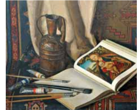
«Натюрморт с репродукцией Кранаха»

художественной выставке «Советская Россия» 1975 года в московском Манеже. А в 1977-м Эдуард Акуваев был принят в Союз художников СССР.