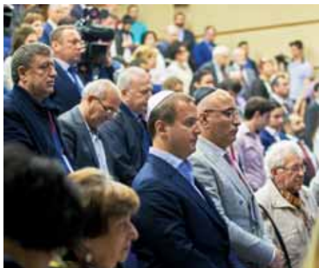
Окончание, начало на стр. 1

У еврейского народа было много героев, но лучше всего помнят Маккавеев – благодаря празднованию Хануки, – заключил рав Лау. Его книга мемуаров «Сквозь глубины», впервые изданная на русском языке при поддержке Фонда СТМЭГИ, также была презентована на конференции.