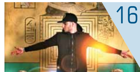
16 Молодой хип-хопер работает над сольным альбомом «Лабиринт»