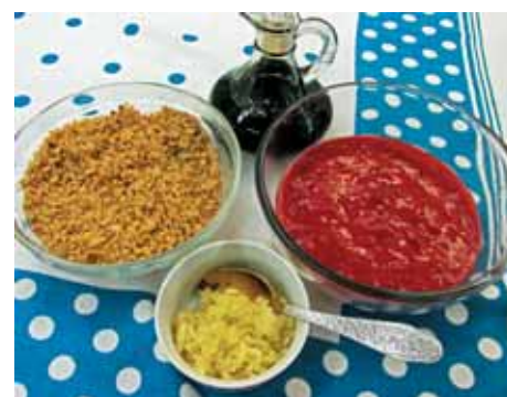
4. Орехи, соус, измельченный чеснок и винный уксус готовы для трапезы