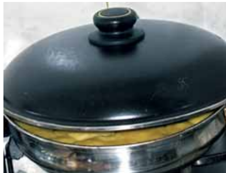
8. Сковороду крышкой полностью не закрываем – пусть выходит пар; через 30–40 минут сверху выступит масло, а на дне образуется корочка