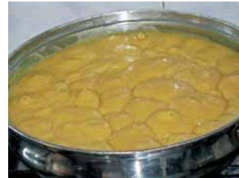
7. Ставим на огонь, а когда начинает закипать, уменьшаем огонь и больше не перемешиваем