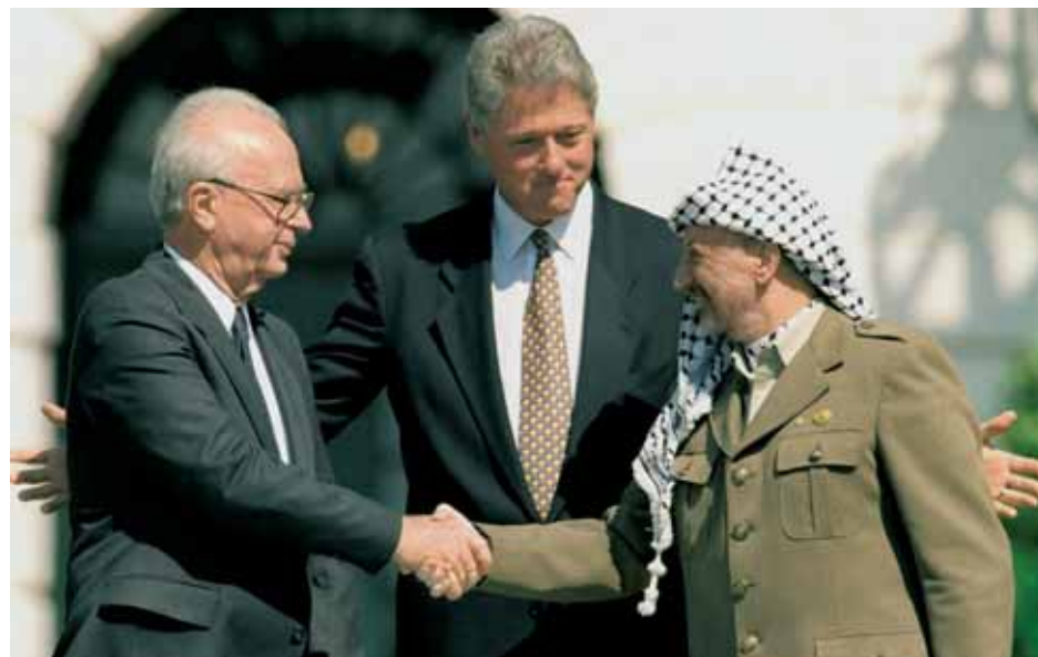
Остановка на полпути: Ицхак Рабин, Ясир Арафат и Билл Клинтон 13 августа 1993 года на лужайке у Белого дома

Впрочем, говорить о превращении «ястреба» в «голубя» — значит сильно всё упрощать. Опрометчиво озвученное желание переломать бунтовщикам кости свидетельствовало скорее о несдержанности, а не о жестокости главы Минобороны: в феврале 1988-го на встрече с активистами партии «Авода» Рабин заявил, что многое усвоил за два с лишним месяца интифады — и в частности, что двумя миллионами палестинцев невозможно управлять с помощью силы. Но было и еще два резона: во-первых, режим военного управления фактически обрекал страну на постоянную вялотекущую войну, а во-вторых — само присоединение оккупированных территорий неминуемо повлекло бы размывание еврейского характера Государства