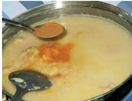
4. Снимаем с огня, наливаем первую часть воды, добавляем соль, корицу и куркуму