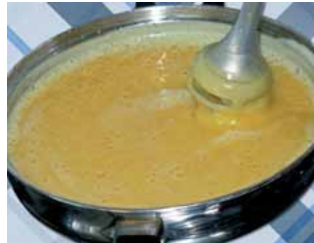
6. Наливаем оставшуюся воду и снова перемешиваем ручным блендером