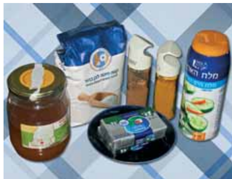
1. Подготавливаем все необходимые для нашего блюда ингредиенты