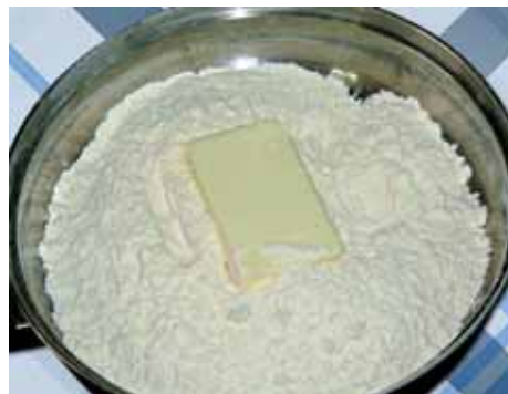
2. В большую сковороду кладем сливочное масло и муку, просеянную через сито