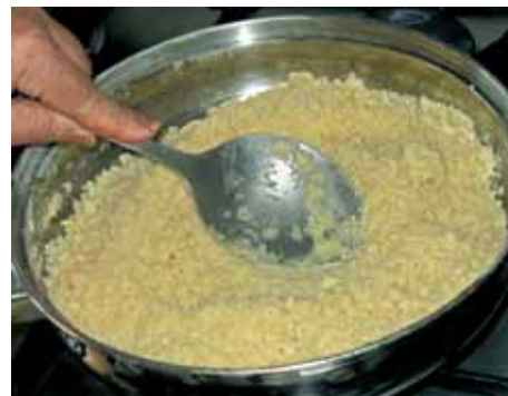
3. Ставим сковороду на огонь и жарим муку 10–15 минут до светло-коричневого цвета