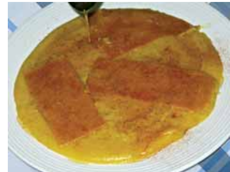
11. Заливаем наше кушанье мёдом, посыпаем корицей и с удовольствием подаем на стол. Приятного аппетита! Халол ишму!