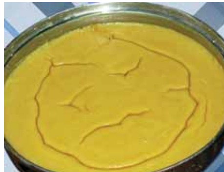
9. Снимаем кушанье с огня и ждем 5–6 минут, чтобы оно немного остыло, а затем осторожно раскладываем Хашиль по тарелкам