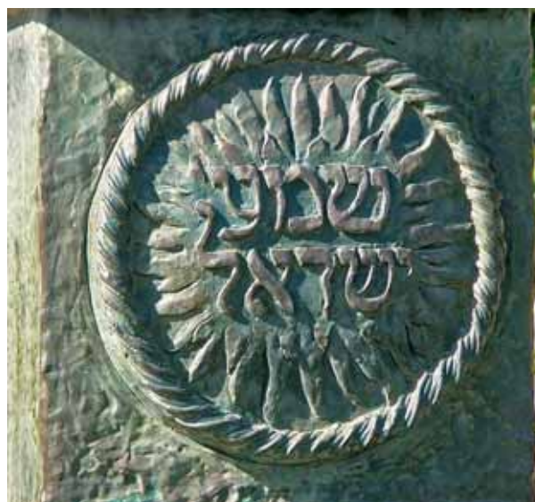
Слова «Шма Израэль» на бронзовой меноре в сквере напротив здания Кнессета в Иерусалиме

В заключение приведем слова Рамхала о том, что, когда мы, читая «Шма», свидетельствуем о Его единстве и признаем, что буквально всё зависит от