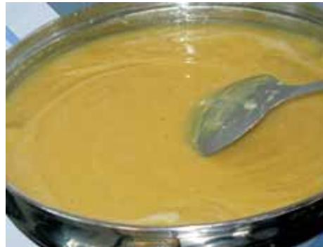
5. Тщательно перемешиваем всё до получения однородной массы