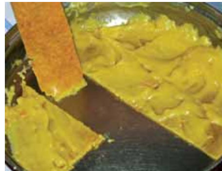
10. Оставшуюся на дне сковороды вкусную корочку разрезаем и раскладываем поверх каждой порции