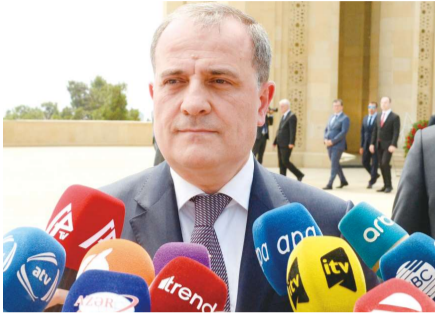
Во время тридцатилетней оккупации, а также после Отечественной

войны мы слышали разные заявления и призывы. Конечно, их необходимо услышать, важно их проанализировать, и мы это делаем, адекватно реагируя на эти заявления и призывы.