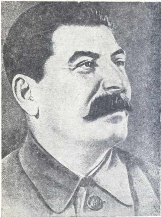
Иосиф Виссарионович Сталин.