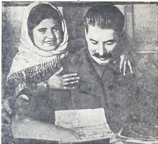
Хъовир Сталин ве Мамлакат Нахангова.

гирд фотографическая карточкай хуьшдере ве зури-зури нуьвуьсд: