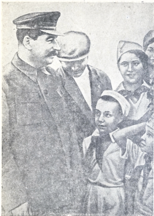
Хьовиргьо Сталин ве Хрущев э гэрей гэнэлгьо э Щелковский аэродром