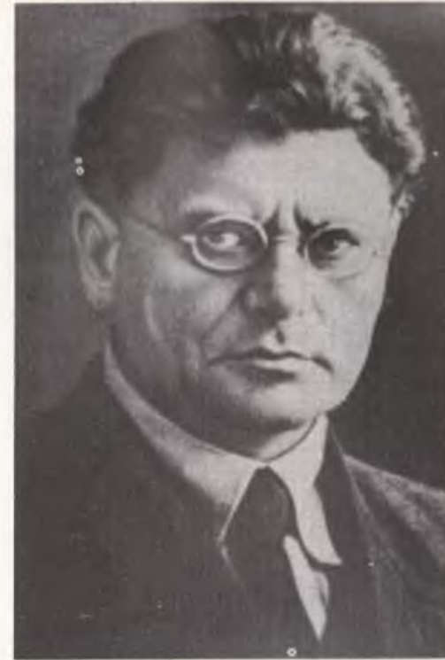
Биненорегор Гуьрдномей товушире Пинхас Рутенберг

Э 1919 сал Рутенберг омореи э вилеет Исроил вэ сер гуьрдени дуразе рэхь андурмишигьой хуьшдере э хьукумет мандат британирево эри вокурде плотина глов дорей зимигьоре вэ э кор оворде энергией товушире. Эри гьевелине сал 1923 Тель-Авив вегурд товуше эз суьфдеи э вилеет станци