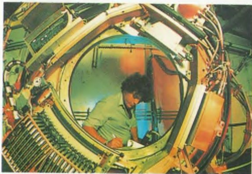
Параменди хоригьурлугьсохи вэ промышленни корхонегьой Исроил. Э звери сирот парникгьо