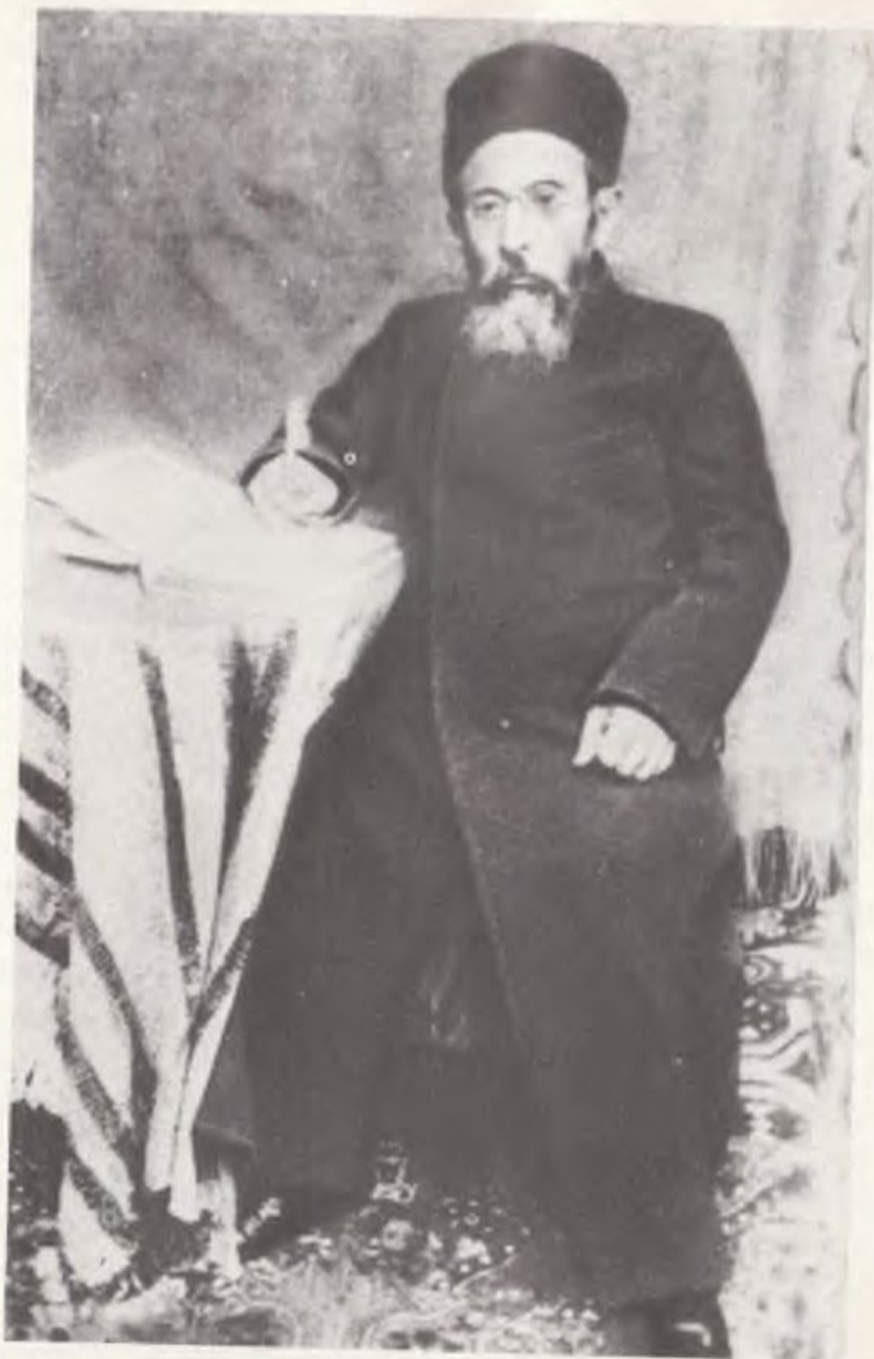
Бинелуье раби шегьер Дербент раби ЯгІэнгил

Уруснет э 1889 сал вэ гьечини гофгьою: "эй эрхгьой догъи э Кавказ (1894 сал)". Гьемчун раби сер кеширенбу э могьлугъ хуьшде, дуре мескенгьо, рэхь бирмунде э угьо. Э гьечи гешдеревоз, кура сохд омбаре материал-фегьми э товун зиндегуни иеудигьой догъи, комики омори э инжо э путешественник Иосеф Ташаранерево. Гье у мэхьэл сер гурд раби исследованием зугьун иеудигьой догъирезугьун татире.