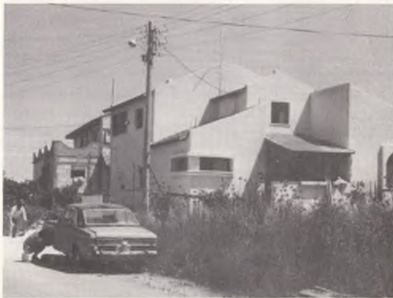
Мескен иеудигъой Кавказ "Хенанит"