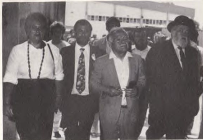
Эз лой чепи э лой расд: Соня Хизгилова, сер хвукумет Ицхак Шамир, сер Шегьер Шабтай вэ хьовир Кнесет — раби Шапиро

Шувер Соня гье омореки э вилеет, дарафди э кор сениглэти хуьшде, слесари, вэ те имбурузине руз кор сохдени э углэре. Бэгьдовой томом сохдеи ульпане, Соняре фурсорут эри хунде повышенни курс иврит, дирте тигьэтие курс сениглэторгьо.