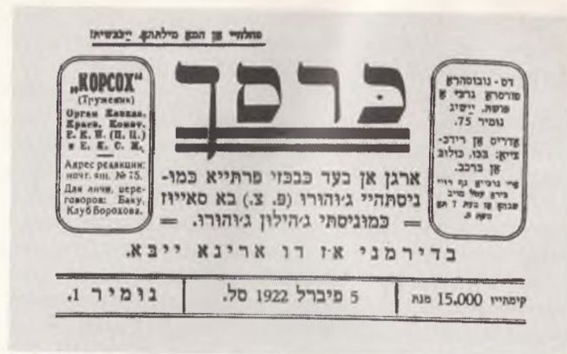
Суьфдеи нумир гозит э зугьун иеуди-тати "Корсох". Баку, 5 феврал 1922 сал

эз ведиромореи гозит "Захьметкеш" э 3 июн 1925 сал, бинелуье редактор комики бу еки эз суьфдеи профессионални литераторгьо-Гласоил Бинаев (1882—1958). Гьеме шогьиргьой 20-уьн салгьо: И. Мататов, Гаврилов, Соломонов, Набинович — бурут шогьиргьой темагьой граждани.