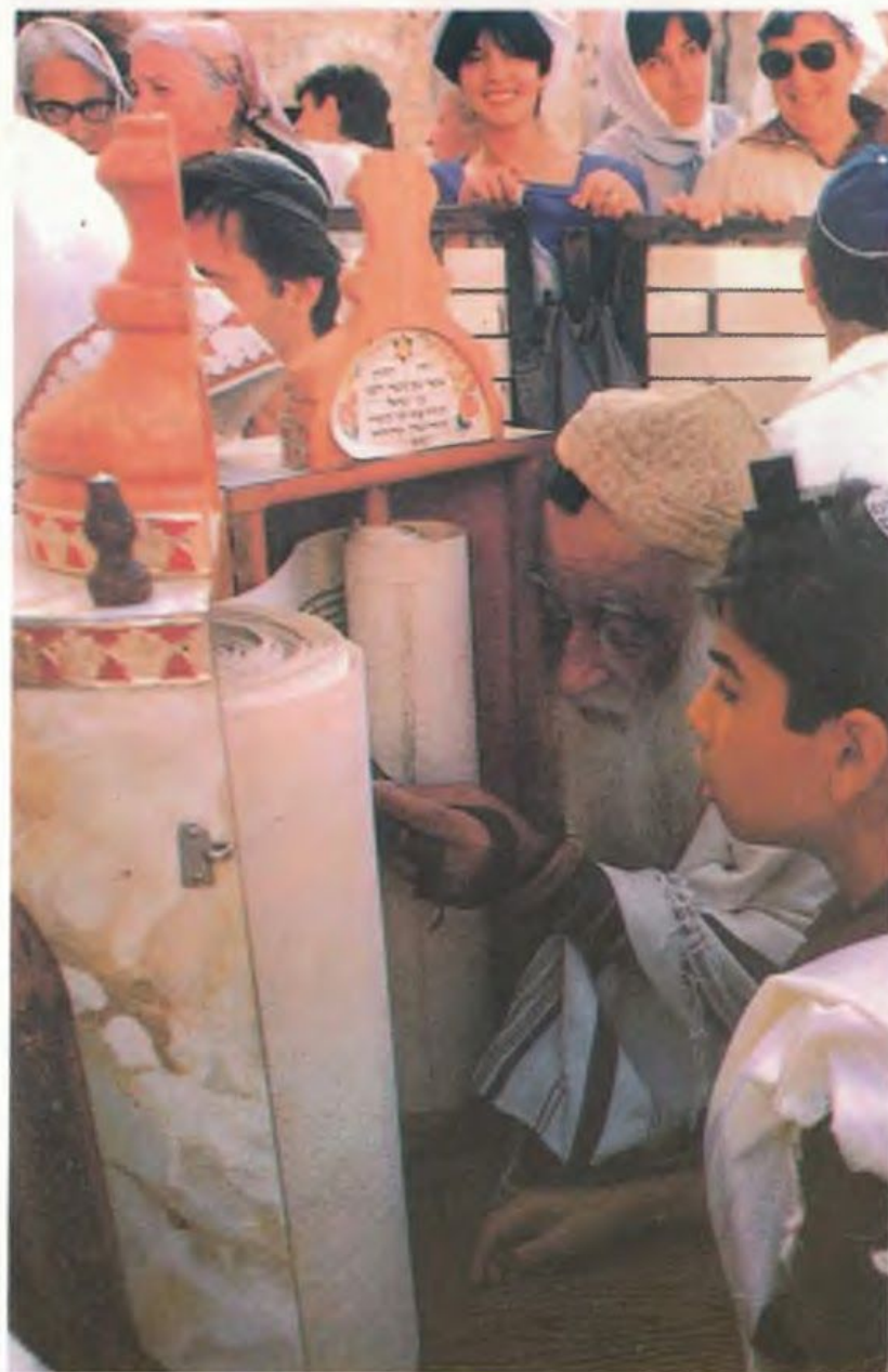
Бар-Мицва (тефилин веноре) з ен Дивор Мэиэров