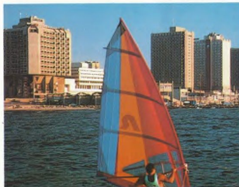
Тель-Авив эз тараф дериегъ