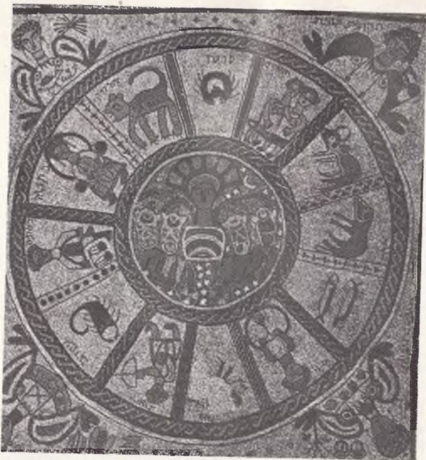
Двазгедь нишонегьой зодиаки. Хори мозаики бет-кнесет Бет Альфа

12 зодикальни нишонегьо бурут гьемчун 12 шивдогьой Исроил, комигьоки хьэсул оморот эз 12 кукгьой Яагъу.