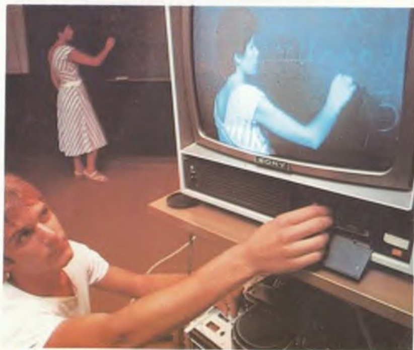
Хундеи з университет Иеуди Ершолем