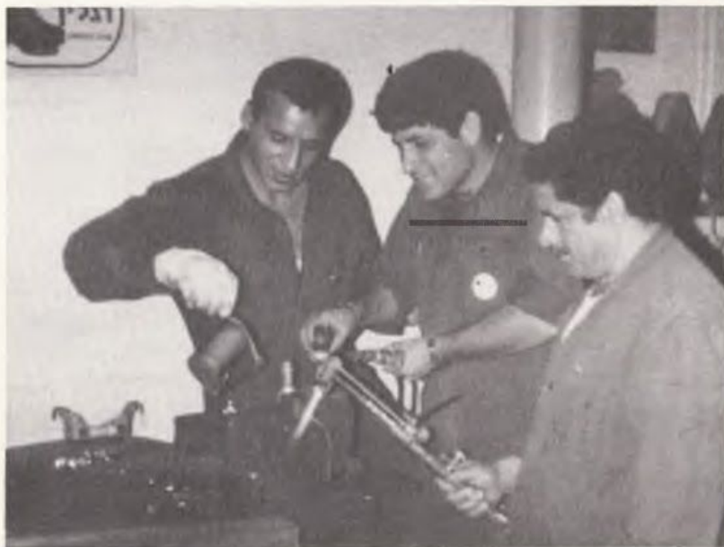
Корсохьгой станци — иеудигьой догьи