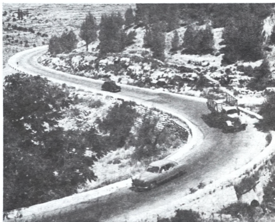
Рэхъ эн Ершолем

Довгого э гІэрей чукле Хьюкмдорго вечарундуйт согъэ серхъэтгьоре, евош-евош чарунде угьоре э кем-мэгІлуьми, ве энжэгъ э вэгІдой хочбергьо (крестоносцы) Вилеет Исроил тозеден хьисоб сохде оморе чуйн согъэ падшогыети. Кулминациони вэгІдой эн у бу кей мезрэгьой падшогыети расиребу эз Бейрут, э сафон те Эйлат, э дором. Серхъэтгьой мизрахъ гирошдембу эз догъгьой Ливонон, (оммо дере нэгІ), гирошдембу э ду-рази Ерденово те Дабарие, ве гьэмчун гирошдембу эз бехш маГарави гьундуьре гьирогъ Ерден (эз Граш не Рабат-Амон бэгъэй). Гьэлбендиной дороми эн падшогыети буьруьт Кирахъ (Ле Крах), шевбахъ – (Монреал), Питра не Эйлат (Айла).