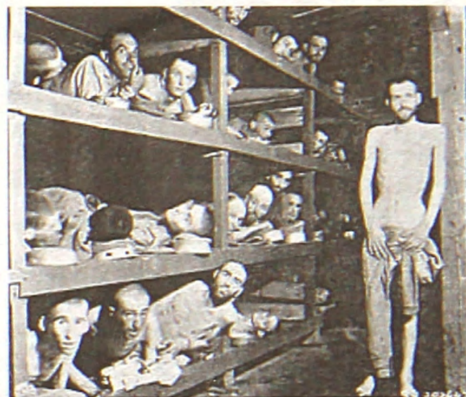
УЗНИКИ СОБИБОРА ВО ВРЕМЯ ВОВ

эз 600 военнопленнигъо. Гьемчуьн унжо дебу лейтенант Александр Печерский, Александр Шубаев ве диеш. У бу суьфдеи эшелон, оморебугъо э Собибор эз Уруссиет. Кимигъо миесдуьт кумек бире э немцгъо, угъо бируьт экуьнди 600 одомигъо, вихде оморетгъо э селекцией хэрекчигъо, шисечигъо дерзигъо, чекмечигъо ве диеш. Э г1эрей вихдегоргъо эз десдей советски жугуьргъо, есиргъо дебу Александр Печерский ве Александр Шубаев. Э лагерь гуьнжуьнде оморебу подпольни гуьрдноме. План эн есиргъо бу вирихдеи эз Собибор, рэхьберьети комики сохдебу А. В. Печерский. Вожиблуь бу огол зере э усдохонегъо гьемме эссесовцигъоре еки-еки ве телеф сохде угъоре. Эз сер суьфде миесд телеф бире жигегир комендант лагерь Нойман, комики оморебу