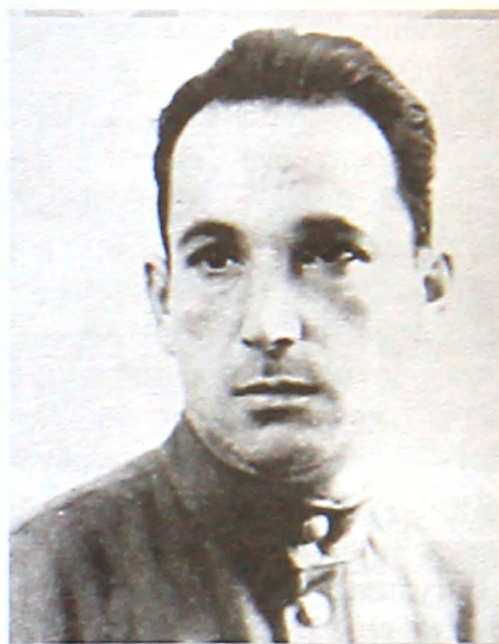
А. АРОНОВИЧ ПЕЧЕРСКИЙ — РУКОВОДИТЕЛЬ ВОССТАНИЯ В СОБИБОРЕ