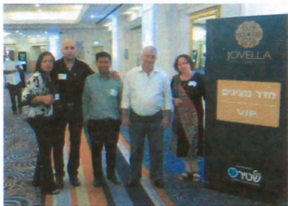
НА 13-Й МЕЖДУНАРОДНОЙ ВЫСТАВКЕ ЮВЕЛИРНЫХ ИЗДЕЛИЙ ИЗ ДРАГОЦЕННЫХ КАМНЕЙ И АЛМАЗОВ В ТЕЛЬ-АВИВЕ «JOVELLA»

— Гьелле, э 18-19 сале гуьмуьр расире, эдее ихдилот сохде Барух, — ме суьфдеи гиле фикир доребируьм эни раче сениг1эт, комики овурдени хубе гьэзенже. Сениг1эт геммолог гьисди келе жогьобдорлуь, чуьн духдир, коми дорени диагноз, ег1элмиш бисдориге, гьемме пуч бире. Ме вохурдем э одомигьоревоз, комигюки бэггюевой