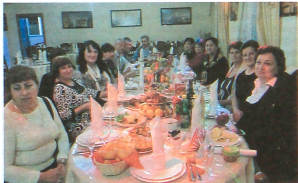
ОБЩИНА г. МОЗДОКА НА ПРАЗДНОВАНИИ РОШ А ШАНА

Дербнтски муниципальни театр жугьургьой догьи бирмунди концерт эри зигьисдегоргьой шегьер Дербенд, э г1уьзет поизлуье мигидгьо э зданией Меркез эстетически тербиедоре «Жасмин». Э г1эрей сегьнегьой спектакль ихдилот сохде оморебу э товун торих поизлуье мигидгьо Рош а Шан, Йом Кипур, Суккот