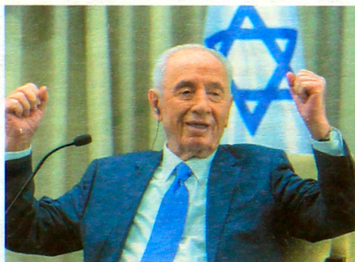
ШИМОН ПЕРЕС — ДЕВЯТЫЙ ПРЕЗИДЕНТ ИЗРАИЛЯ

Политик был известен своими философскими высказываниями, а его книга «По обе стороны стены» стала настольной для многих политиков и государственных деятелей.