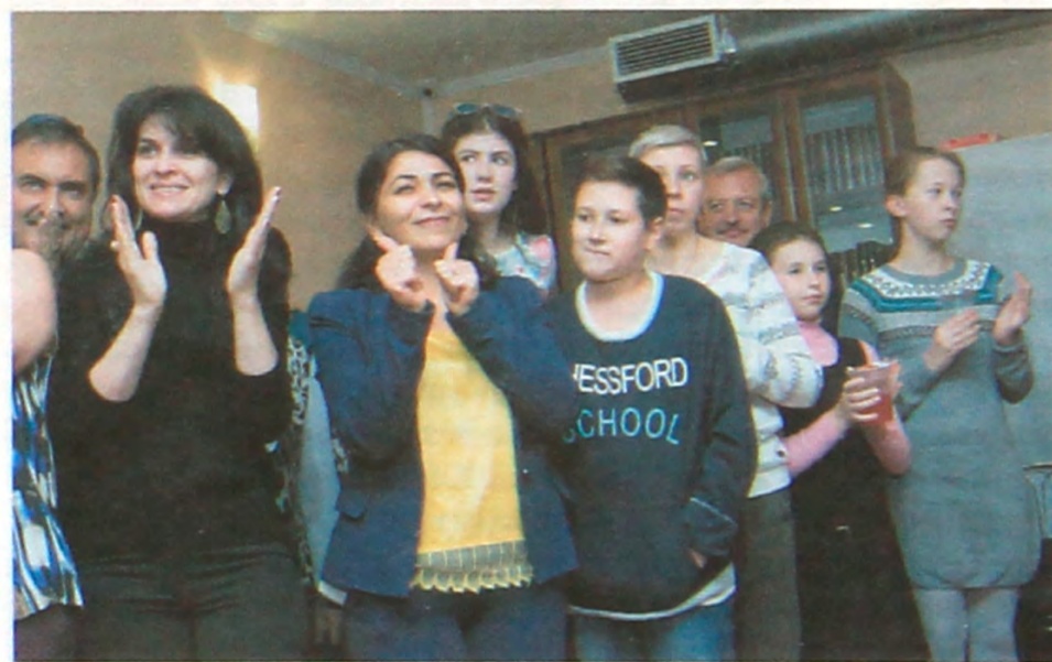
ОБЩИНА г. СТАВРОПОЛЯ НА ПРАЗДНОВАНИИ РОШ А ШАНА