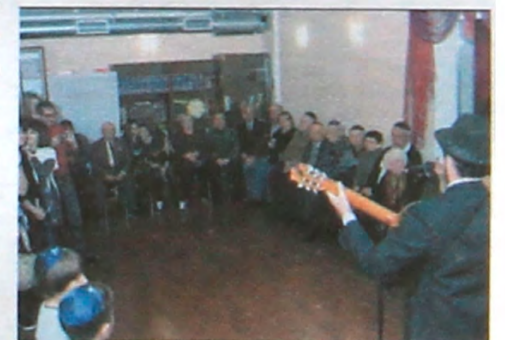
г. СТАВРОПОЛЬ. ЕВРЕЙСКАЯ ОБЩИНА НА ПРАЗДНИЧНОМ МЕРОПРИЯТИИ РОШ А ШАНА

Также праздничные мероприятия прошли в городах Ставрополь, Моздок и др.