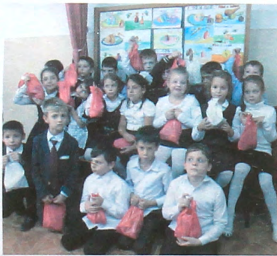
ДЕТИ С НОВОГОДНИМИ ПОДАРКАМИ ИЗ ЕВРЕЙСКОЙ ШКОЛЫ «ГЕУЛА» г. ПЯТИГОРСК

В Дербенте накануне празднования Рош а Шана еврейская религиозная община синагоги Келе-Нумаз организовала и провела детский праздник для детей и их родителей. На праздник собралось более 70 человек. В банкетном зале общинного центра в дружной семейной атмосфере участники говорили о законах, традициях и обычаях этого праздника. Для детей была организована викторина, игры на праздничную тематику и праздничное угощение.