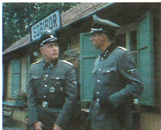
НЕМЦЫ НА СТАНЦИИ СОБИБОР

Есиргъо й еки эз гитлеровски фабрикей ульуьми бердет э глхмиши, телеф сохде немецки офицергъоре, ведиреморет э азади. У бу еки эз дурьужде вирихдеигъо военнопленнигъо э вэхд Буьзуьрге довг1ой Ватани, еки эз рэхьбергъой комики бу жугур догъи эз шегьер Хасавюрт Александр Шубаев. Ижире гъозие гиросхебу 14-муьн октябрь э 1943-муьн сал э немецки концентрационни лагерь, нушу доре оморебугъо э више, экуьндигъой дигъ Собибор э район Люблин э Польше. Лагерь э гъэдер 400 э 600 метро э иловле, гьемме э бенд бугъо э теллуте гъовугъоревоз ве доргъоревоз пэхъни сохдебу эз чумгъой одомигъо. Пространство э г1эрей сеймуьн ве чоримуьн жергъо бу заминирован. Ве гешдебируьт патрулгъо. Рэхъ гъовуни дарафдебу э тупик, чуьнки нушу доробу гъэлхэнди суре.