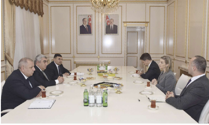
27 Января, в Международный день памяти жертв Холокоста, совершила визит в Красную Слободу временный поверенный в делах Соединённых Штатов Америки в Азербайджане Эми Карлтон.