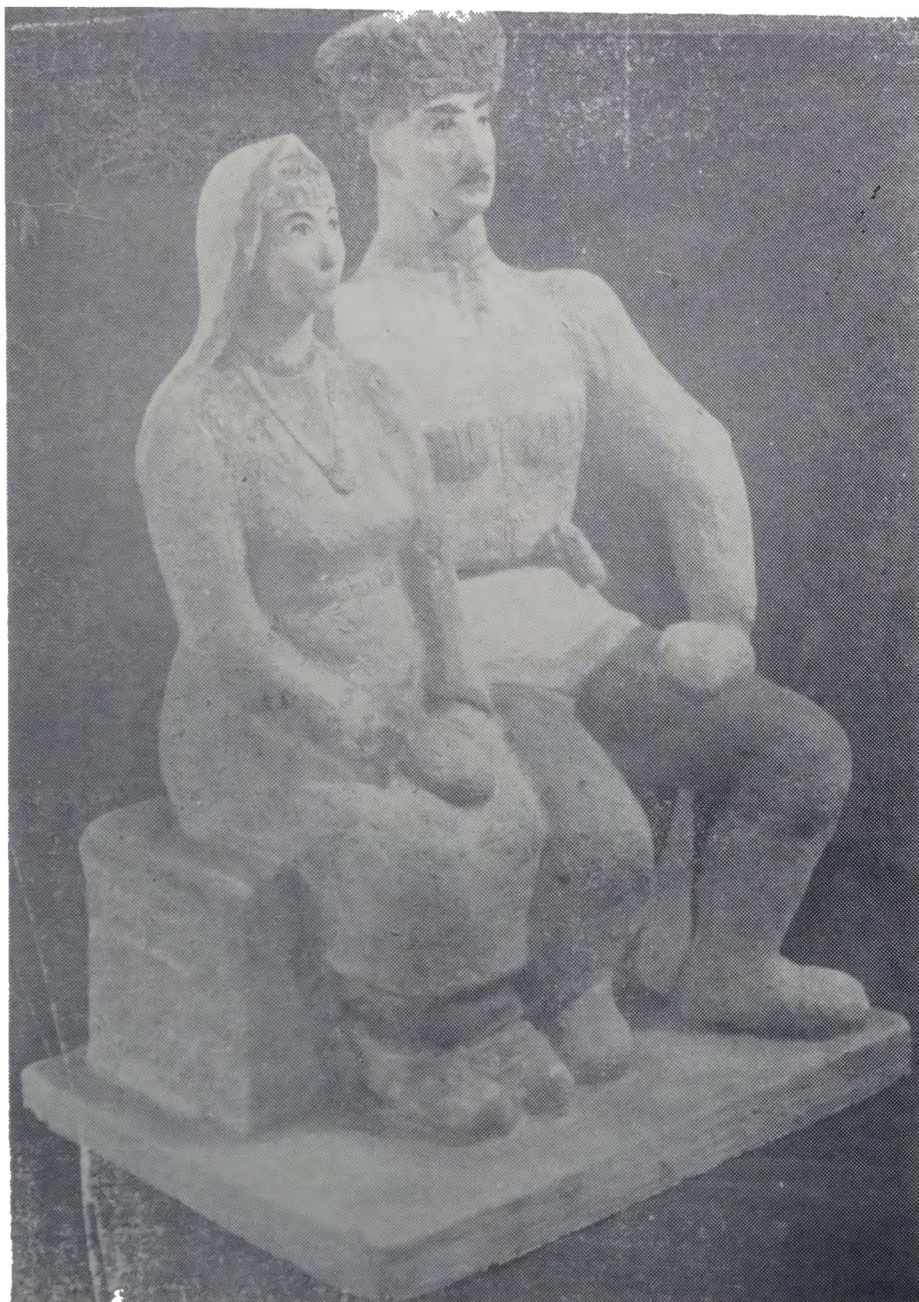
Скульптурная композиция „Семья“