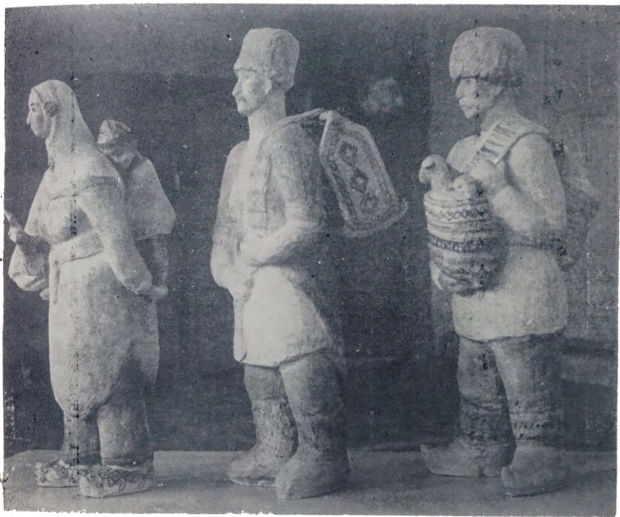
Скульптурная композиция „С базара“