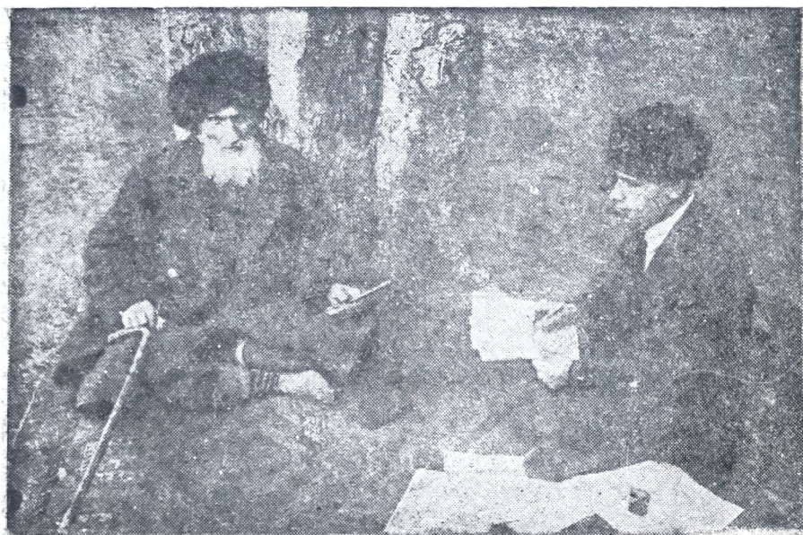
Э сирот м. научный корсох Х. Авшалумов эдее нуьвувьсде ихди- лотгьо эз гофгьой 80 сала мэгІлутьмлуйе овосунечи Хьызгьий Дадашев.