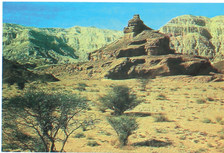
Биебу эн Негев