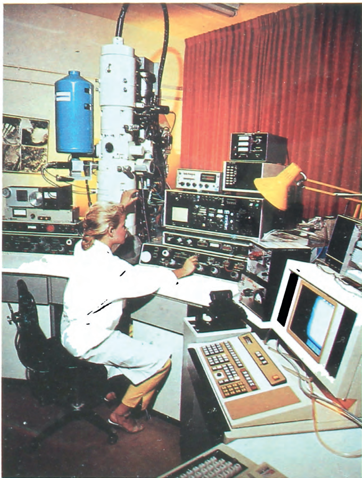
Лабораторией технион Хайфа