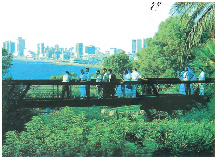
Парк э Яфо