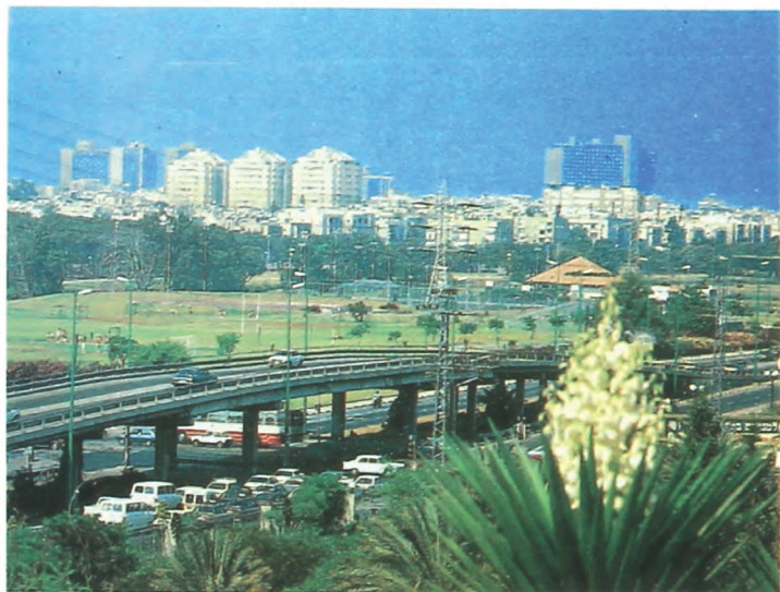
Илчи Хэйфа э Тель-Аовио