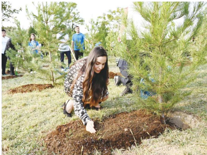
23 сентября в парке "Гянджлик" в Хатаинском районе Баку состоялась акция по посадке деревьев. Как сообщает АзерТАдж, в мероприятии приняли