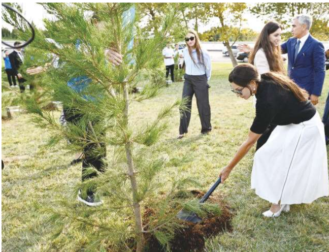
участие президент Фонда Гейдара Алиева Мехрибан Алиева, вице-президент Фонда Лейла Алиева и члены их семьи.

В ходе акции, в которой приняли участие волонтеры Общественного объединения "Региональное развитие" Фонда Гейдара Алиева и COP29, была высажена 1000 эльдарских сосен.