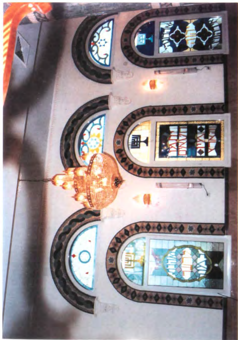
Витражи окон синагоги в Акко.