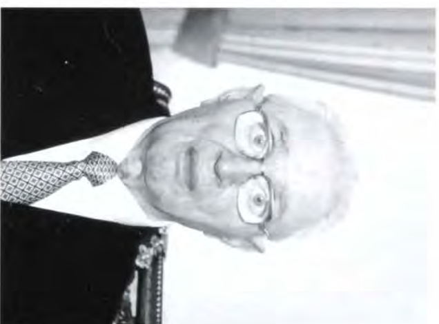
Абрамос Мардохай Ханукаевуи